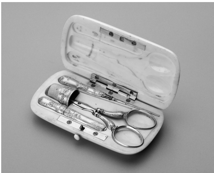
Šicí souprava, střední Evropa, 2. polovina 18. století, stříbro zlacené, slonovina, glass, UPM v Praze