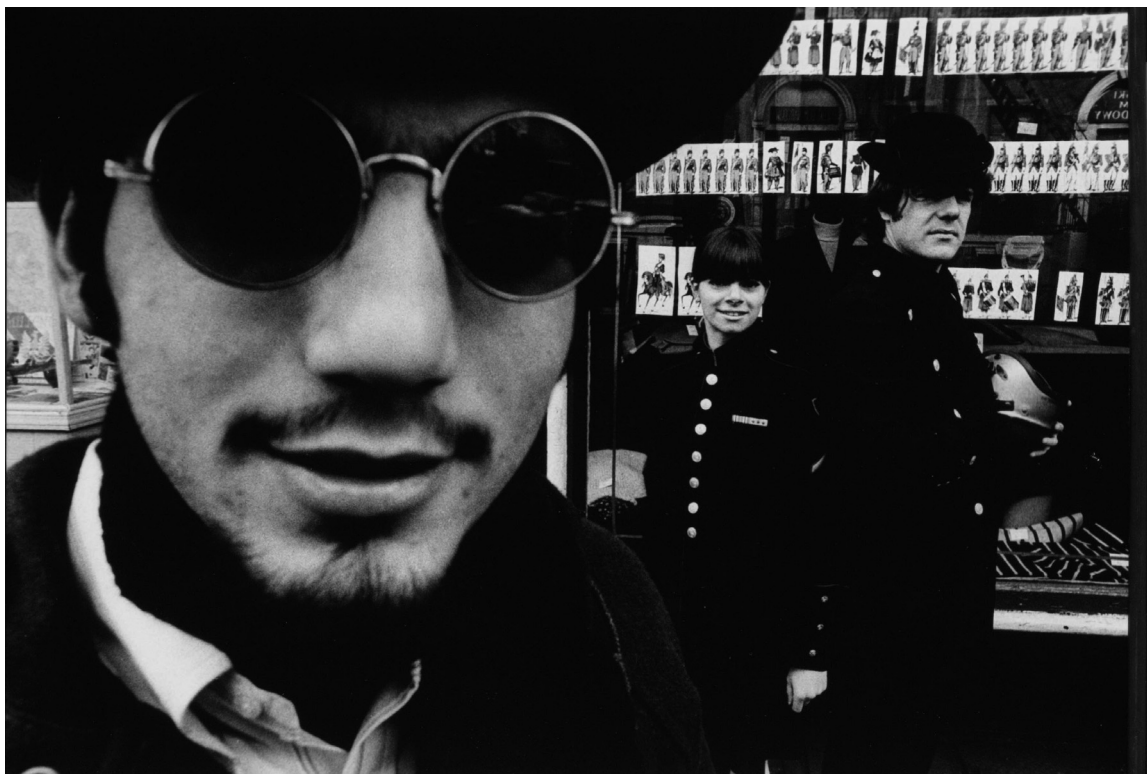
Carnaby Street v Londýně, 1971

roval i dva celovečerní filmy. Po návratu do Ameriky založil na předměstí Bostonu specializovaný ateliér na svatební fotografii, kde zaměstnával několik asistentů.