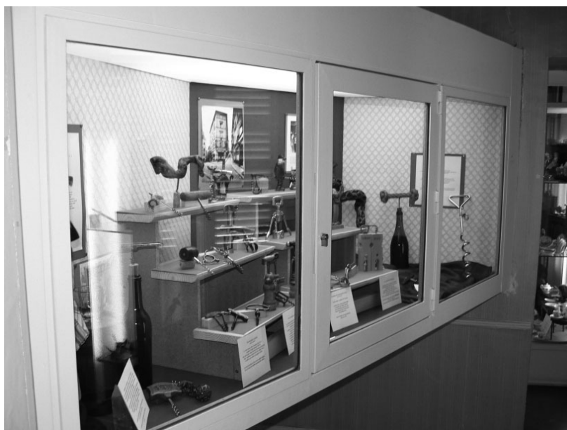
Muzeum v Beaujau

jsou na život a práci svých předků pyšní – předměty jako by byly před chvilkou odejmuty z rukou zručných vinařů a s krásnými znaky toho, že byly používány (ošoupání, jemné odření), umístěny do roztomilých vitrín, kde je šikovné ruce opatřily ručně psanými popiskami. Beaujau je zkrátka kouzelné místo, které určitě stojí za to navštívit.