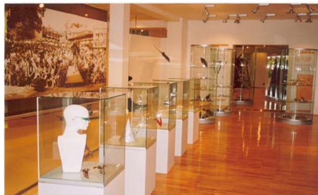
Fotografie z nové stálé expozice Kouzelný svět bižuterie a čarovná zahrada skla