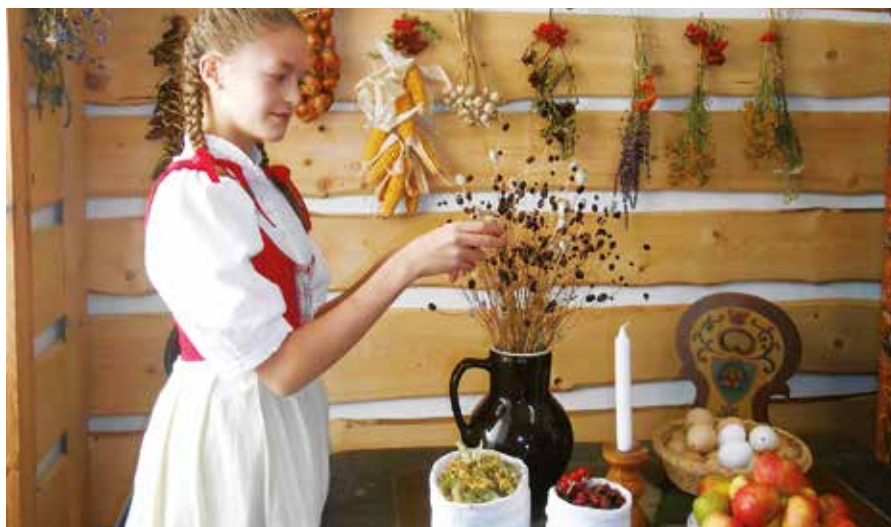
Kostýmované prohlídky na EHD 2015, v podání žáků ZŠ Hornická

Startovala kurikulární reforma českého školství, tvořily se rámcové vzdělávací programy (RVP) a na ně navazující vzdělávací plány jednotlivých škol. Do českého školství masově vtrhl fenomén projektového vyučování. Pochopili jsme, že pro úspěšnou spolupráci se školami se musíme