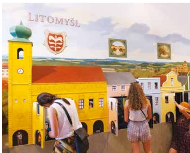
Z expozice Račte vstoupit