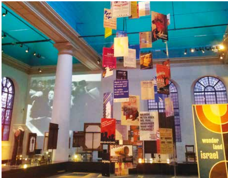
Metoda I ASK byla testována v Židovském historickém muzeu v Amsterdamu

muzejního světa často odkazuje na princip „muzea 2.0“, který se snaží využít potenciál reprezentovaný webovými stránkami „web 2.0“. Jádrem koncepce je zde „uživateli generovaný obsah“: jsou to právě uživatelé, kdo obsah vytváří. To stírá tradiční rozdíl mezi producenty (muzejními kurátory) a uživateli (veřejností), na základě předpokladu, že různí lidé mají specifické znalosti, které mohou vzájemně doplňovat. Skutečná participace může být úspěšná pouze v případě, že muzeum veřejnosti naslouchá a její názory reflektuje.