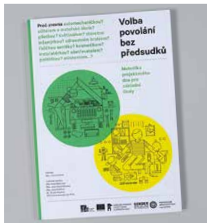
1. místo NČKR 20 14 v kategorii učebnic

Účastníci setkání se shodli na tom, že je třeba v diskuzích pokračovat. Organizátorovi bylo doporučeno, aby se Metodické centrum zaměřilo na vytvoření metodického materiálu, který by vymezil estetická kritéria zohlednitelná a uplatnitelná při tvorbě učebnic. ■