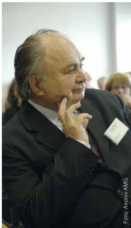
Na sympoziu Muzealizace v soudobé společnosti a poslání muzeologie, 2006