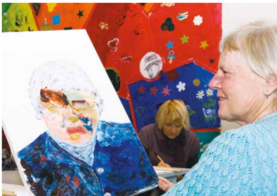
Projekt Umění spojení Lektorského centra GASK v Kutné Hoře

S postupně se etablující profesí muzejního pedagoga nacházíme adekvátní odezvu (v souladu s obecnými změnami ve společnosti, zejména v průběhu posledních patnácti let) ve stále silnějším akcentu na zpřístupňování muzeí a jejich sbírek jednotlivým skupinám osob se specifickými potřebami. Inkluzivní muzejní pedagogiku, která tuto problematiku teoreticky a metodicky zastřešuje, můžeme