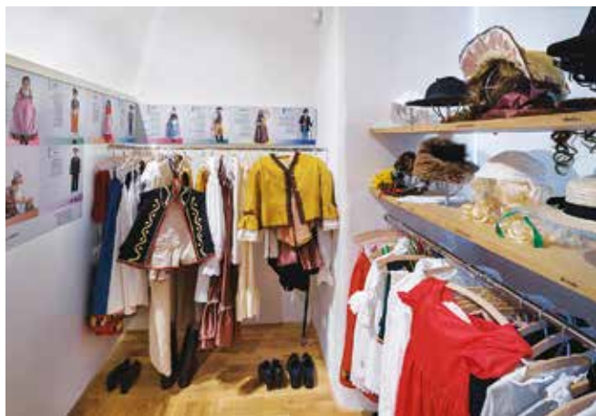
Převlékárna v etnografické expozici litomyšlského muzea