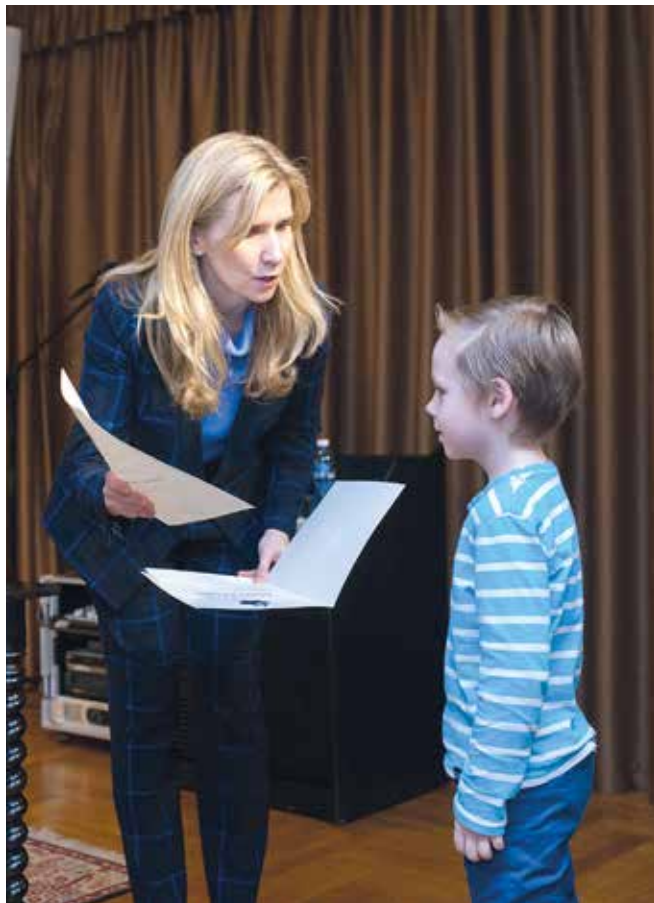
Kateřina Valachová na setkání s dětskými hrdiny v Národním pedagogickém muzeu J. A. Komenského v lednu 2016