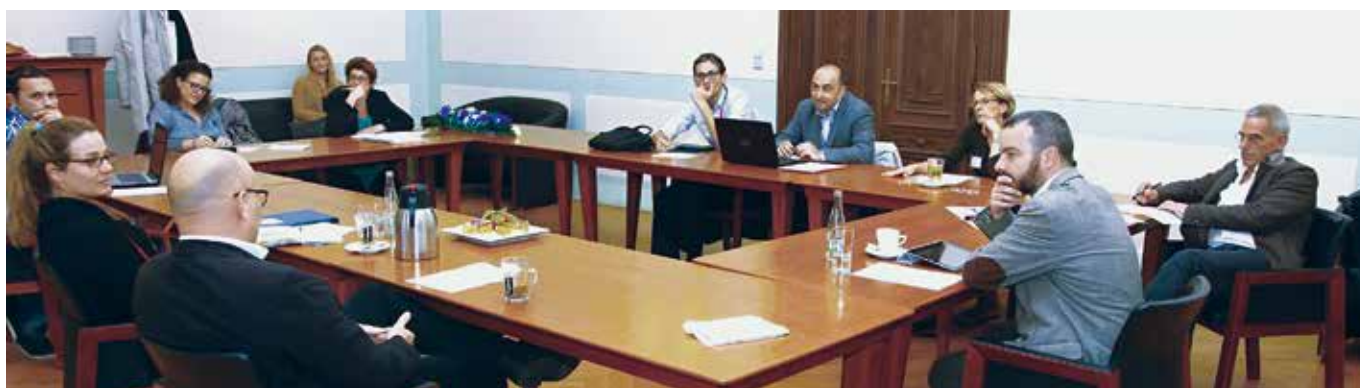
Setkání pracovní skupiny LEM na konferenci NEMO v Plzni v listopadu 2015

Otázky kladla a z angličtiny přeložila DENISA BREJCHOVÁ