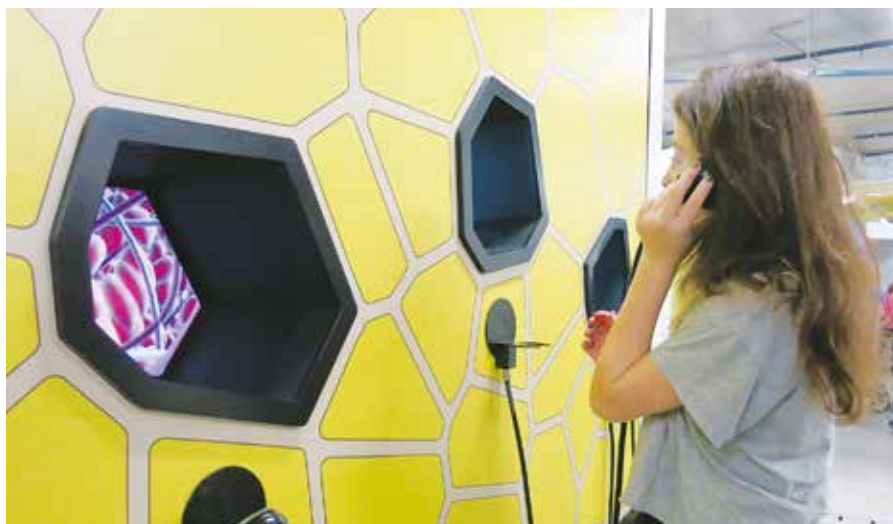
Příklad didaktických exponátů z expozice Světa techniky v Ostravě Vítkovicích

individuálních návštěvách muzeí, ale i v rámci řízené edukace.