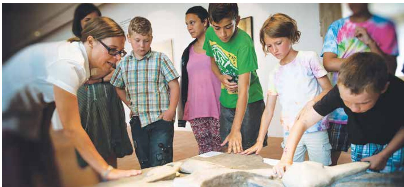
Projekt Umění spojení Lektorského centra GASK v Kutné Hoře

Neuniverzitní vzdělávání reprezentuje kurz Základy muzejní pedagogiky Metodického centra muzejní pedagogiky, které rovněž nově realizuje centrální portál edukačních aktivit muzeí a galerií MuzeoEdu. Dalším oborově profilovaným metodickým centrem je Centrum pro prezentaci kulturního dědictví, se specializací mj. na metodiku školení pracovníků „v první linii“ a s oborovým informačním portálem eMuzeum. Další