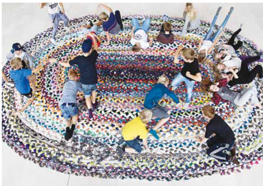
Národní galerie v Kodani získala ocenění Children in Museum za rok 2014