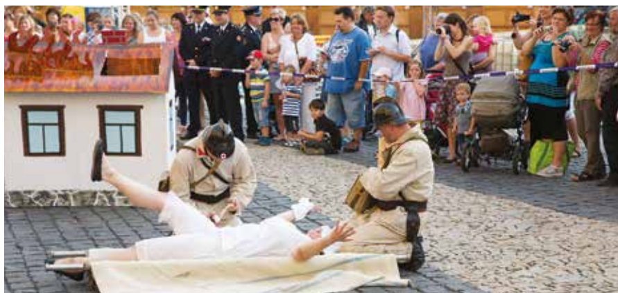
Vernisáž výstavy „Hoří!“ s ukázkou poskytnutí první pomoci

Čtyřleté zkušenosti a zpětná vazba návštěvníků nejen ze školního prostředí nám ukázala, že o tento typ výstavních počinů je velký zájem. Témata ostatně korespondují s aktuálními problémy dnešní společnosti. Také v příštím roce přinese cyklus do mělnického muzea zajímavé téma z historie a současnosti sociálně negativních jevů, aby tak i toto prostředí podpořilo formování zdravé osobnosti u mladé populace. Muzea se tak pozvolna stávají místem přirozené podpory specifické primární prevence. ■