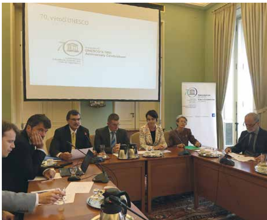
Seminář se konal v Čerínském paláci

Výsledek semináře ukázal, že Česká republika dokáže nabídnout své experty světu a bude tak činit především prostřednictvím UNESCO, ICOM a Českého komitétu Modrého štítu. ■