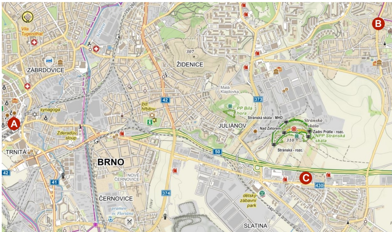
A – hlavní vlakové nádraží, B – penzion U Libušky, C – Botanické oddělení MZM.

Spojení městskou hromadnou dopravou (funguje oběma směry):