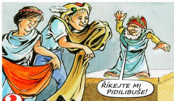
6. Přestroj se za krásku ze starých pověstí!