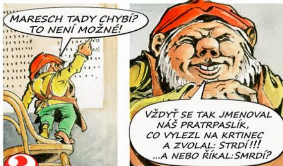
11. Zjisti, který hrdina nosil Tvé nové jméno!

MAKRESLIL: ZDENĚK URBAN, NAPSAL: MARTIN KOSEK, GRAFICKÁ ÚPRAVA: VLADIMÍR ČETTL, VYROBIL: MUZEUM MĚSTA ÚSTÍ NAD LABEM K VÝSTAVĚ "STARÉ POVĚSTI ČESKÉ" V ROCE 2016