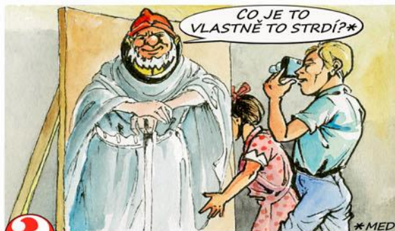
9. Vyfoť se jako praotec Čech!