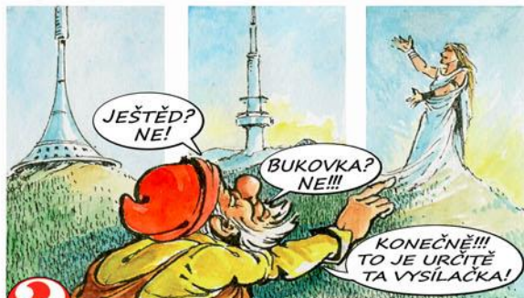
7. Najdi vysílačku Libuši!