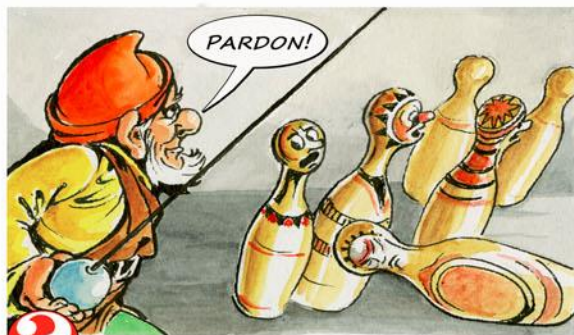
8. Pokácej modly!