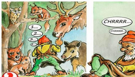
10. Najdi všechna zvířátka v pralese!