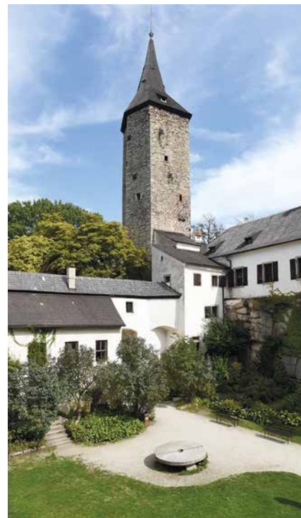
Nádvoří hradu Roštejn

Oba výše uvedené projekty jsou výsledkem dlouhodobé spolupráce českých a rakouských příhraničních regionů a v souladu s Dohodou o spolupráci mezi spolkovou zemí Dolní Rakousko a kraji Jihomoravským, Jihočeským a Krajem Vysočina. ■