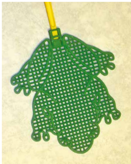
Plácačka na mouchy, 2. pol. 20. st.

nabízeno charitativním institucím, spolkům, uživatelům sociálních bytů či studentům, zařizujícím si bydlení. Neuplatněné předměty má posléze možnost získat veřejnost za symbolickou cenu buď přímo ve skladu, nebo na retro-bazaru v brněnské Alfa pasáži. Prostředky získané tímto prodejem slouží ke zcela konkrétnímu účelu – jsou investovány do výsadby městské zeleně v Brně.