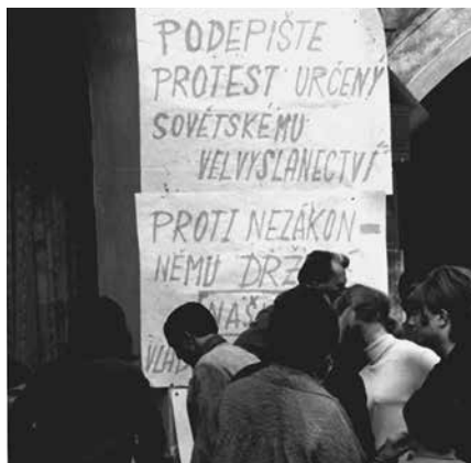
Protestní podpisová akce proti okupaci na náměstí v Českém Krumlově