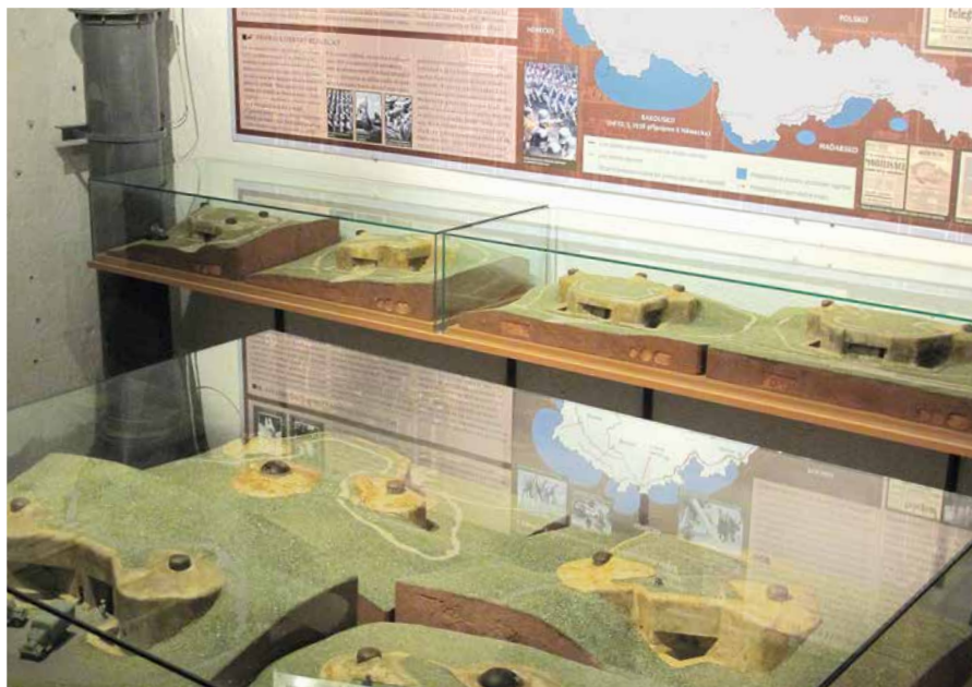
Expozice v levých kasematech

V roce 2011 byl ve spolupráci s Kongregací Nejsvětějšího Vykupitele otevřen jako pobočka muzea Památník obětem internace Králíky v nedalekém klášteře na Dolní Hedeči. Dále připravujeme také v České republice ojedinělý Východočeský památník celnictví v budově na králickém náměstí, která dosud z části slouží jen jako odborná knihovna a depozitář muzea. Co se týče správy sbírek, např. pro řeholní instituci, se jedná o segment kulturního dědictví navráceného z části v mimosoudních restitucích (vyňato z CES). U vybraných sbírkových předmětů není také bez zajímavosti, že se