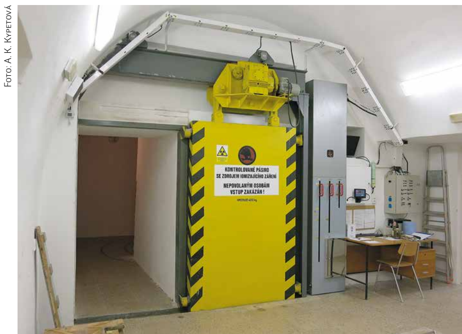
KOP po rekonstrukci v roce 2017

Tímto směrem se bude vývoj nutně ubírat i nadále, již nyní nabízejí tyto vyhledávače informaci o více než 400 000 mapách. Není podstatné, zda jde o knihovnický, muzejnický či archivářský software pro evidenci. Podstatné je, že jsou data strukturovaná a zapsaná podle dohodnutých formálních pravidel, což umožňuje jejich propojení. Vyhledávání nazýváme jako „časoprostorové“. Uživatel dostane rychlou odpověď na tři základní otázky, které si se starými mapami asociujeme: „Jaké území mapa pokrývá?“, „Kdy vznikla?“ a „Jak je podrobná?“ - Díky těmto údajům je možné mapové sbírky nejen prohledávat, ale vyhledané mapy řadit i podle relevance. Uživatel, zajímající se například o oblast Moravy, dostane na prvních místech mapy, pokrývající celou Moravu a ne například celou