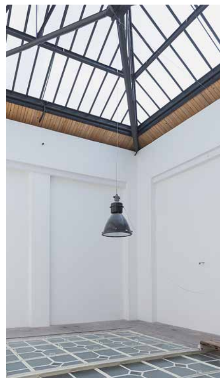
Světlík ve vile Löw-Beer