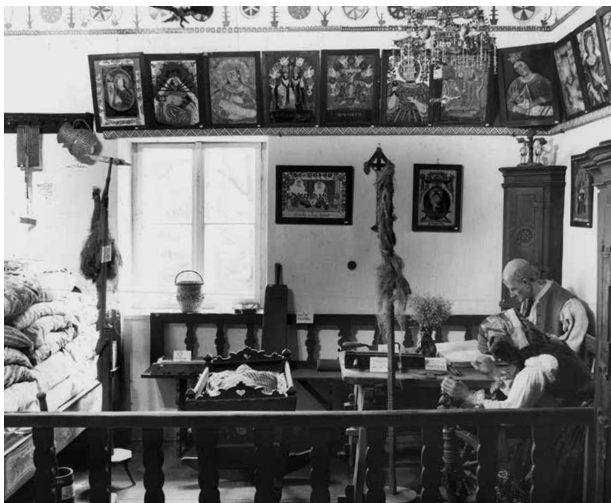
Interiér muzea v roce 1943

Lázeňské město Luhačovice, ležící v příhodné blízkosti historické hranice se Slovenskem, je známé úzkými vztahy se slovenskou kulturou. Národovci a vlastenci z obou stran hranice se zde setkávali již od druhé poloviny 19. století. Od počátku 20. století zde byla na poradách Československé jednoty cíleně rozvíjena kulturní, hospodářská a politická spolupráce mezi oběma národy a byly formulovány základní teze o budoucím společném státě Čechů a Slováků. I z tohoto úhlu pohledu je letošní stoleté výročí muzea důležité a doslova symbolické. Výročí oslaví muzeum celoročním výstavním programem a doprovodnými projekty, zejména výstavou „Muzeum staré jako Československo“, která bude zahájena dne 28. června 2018 krojovou přehlídkou s průvodem a doplněna mezinárodní konferencí ve dnech 29. až 30. listopadu 2018. ■