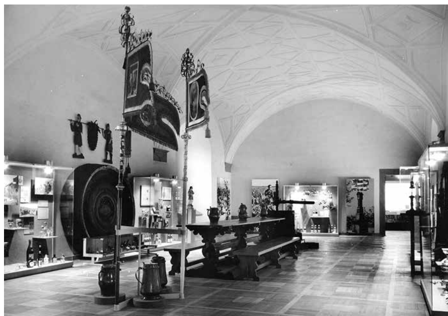
Expozice českého vinařství na zámku

Od roku 2003 je zřizovatelem muzea Středočeský kraj, který poskytuje dostatečné zázemí pro jeho činnost. V současné době mělnické muzeum přiláká kolem 40 tisíc návštěvníků ročně. ■