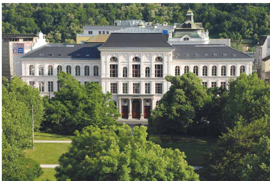
Sněm AMG se uskuteční 28.–29. listopadu 2018 v Muzeu města Ústí nad Labem

V závěru roku 2017 byly předsedům Krajských sekcí AMG rozeslány dopisy s výzvou k zapojení se do přípravy podkladů pro jednání XII. Sněmu AMG, k předložení návrhů Hlavních linií činnosti AMG na období let 2019–2021 , návrhů do Kandidátní listiny pro volby do funkcí v Exekutivě AMG a v Revizní komisi AMG pro toto období a případných návrhů na změny Stanov AMG, a to do 30. června 2018. Všechny potřebné informace a materiály budou uveřejněny na webových stránkách AMG. K tématu blízkého se Sněmu AMG bude v blízké době uspořádáno setkání Exekutivy AMG s předsedy