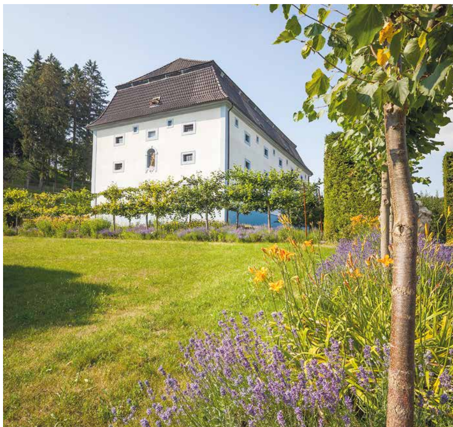
Pohled na muzeum

Jako majitelé a provozovatelé zámeckého areálu jsme pochopitelně již při rekonstrukci řešili otázku, jakou funkci a náplň opraveným objektům dáme. V zámku máme rozsáhlou expozici nábytkového umění od baroka až po secesi, kterou jsme vytvářeli za velkorysé spoluúčasti Uměleckoprůmyslového musea v Praze. Barokní sýpka, jako mimořádná technická památka, si „říkala“ o technické exponáty. Jaké? To jsme zvažovali víceméně vylučovací metodou. Řídili jsme se přitom zásadou, že musí být dostatečně atraktivní i pro tzv. většinového návštěvníka, nesmí být příliš robustní, musí snášet přes zimu nevytápěný