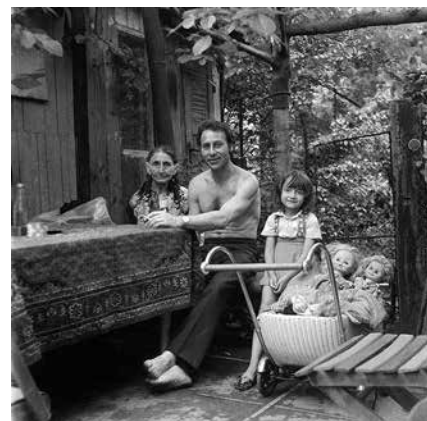
Posezení s rodinou, 70. léta 20. století, Brno-Obřany