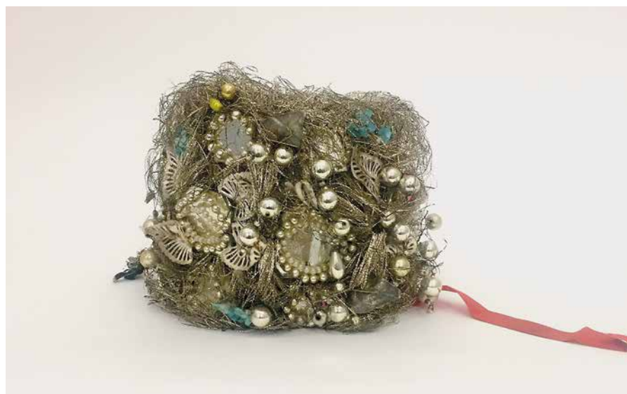
Horácká svatební koruna

Ve sbírce jsou zastoupeny předměty, které budou zařazeny do několika podsbírek muzea, nejčastěji dle materiálového rozlišení. Nejvíce je dřevěných předmětů (např. soubor interiérových lidových křížů, zemědělských a řemeslných nástrojů, velká sbírka modrotiskových forem nebo forem na máslo). Jedním z nejvýznamnějších předmětů je patrně horácká svatební koruna z Dlouhé Vsi a další oděvní součástky z poloviny 19. století. Sbíрка obsahuje i zajímavé hudební nástroje (skřipky, niněru a trumšajt baset). Několik desítek kusů obsahuje soubor dýmek od dřevěných po