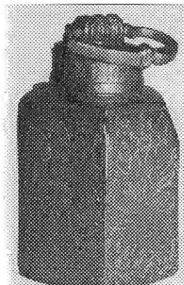
foto: Cínová láhev se šroubovým uzávěrem. Kutná Hora, první čtvrtina 18. století.

Velká epocha vrcholného baroka, která na Kolínsko přichází brzy po roce 1700, je proto až na výjimky reprezentována pražskou a kutnohorskou produkcí. Vedle prací z ateliérů významných mistrů Františka Preise, Matěje Václava Jäckela i Ferdinanda Maxmiliána Brokofa se zde setkáváme se souborem děl Jana Jiřího Šlanzovského. Poprvé jsou představeny nově rozpoznané práce kutno-