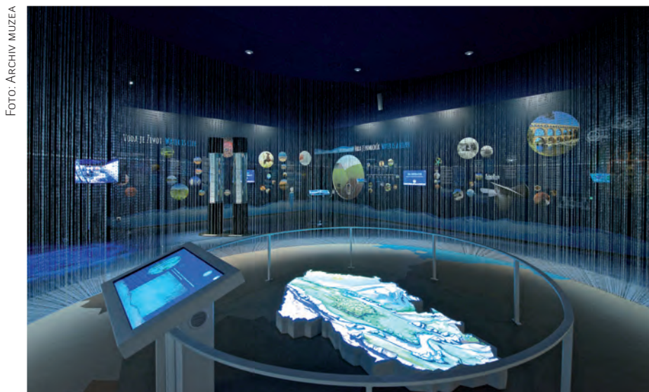
Využití audiovizuální techniky v expozici Voda v krajině

Podívejme se na konkrétní výhody a několik příkladů z praxe ukazující, jakým způsobem naše muzea využívají k obohacení svých projektů digitální