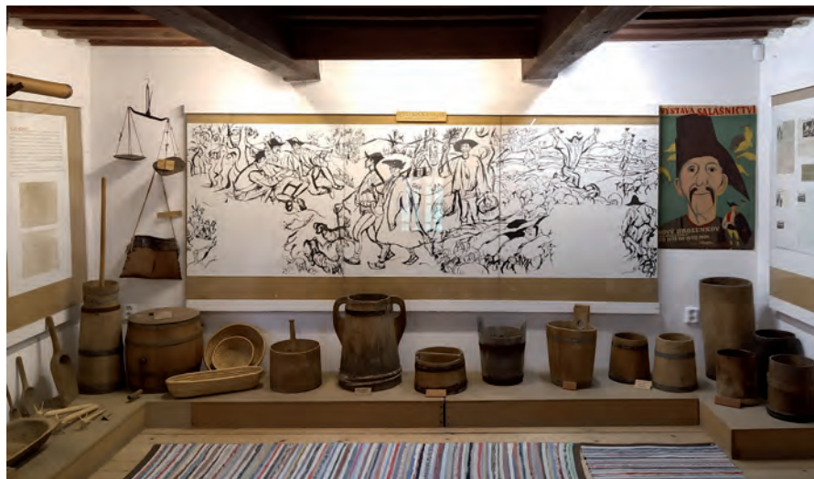
Řádný člen AMG Muzeum Nový Hrozenkov