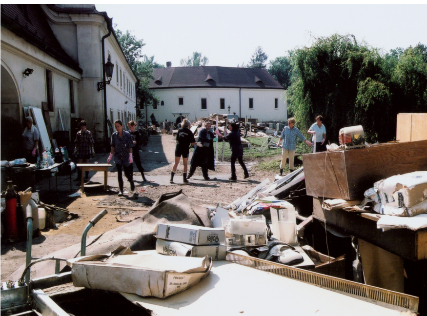
Likvidace následků povodní ve Středočeském muzeu v Roztokách u Prahy

Tak jak se našťastí nenaplnily některé naše obavy ze škod, které jsme původně očekávali, tak se naopak postupně objevila poškození, která bezprostředně po opadnutí vody nebyla patrná. Tak tomu bylo s expozicí umístěnou v přízemí Muzea Malé pevnosti, která byla věnována dějinám Policejní věznice pražského gestapa, která v tomto prostoru existovala v letech 1940-1945. Vzlínáním se voda z původních asi 50 centimetrů vyšplhala až do výše zhruba jednoho metru. To si vynutilo zrušení expo-