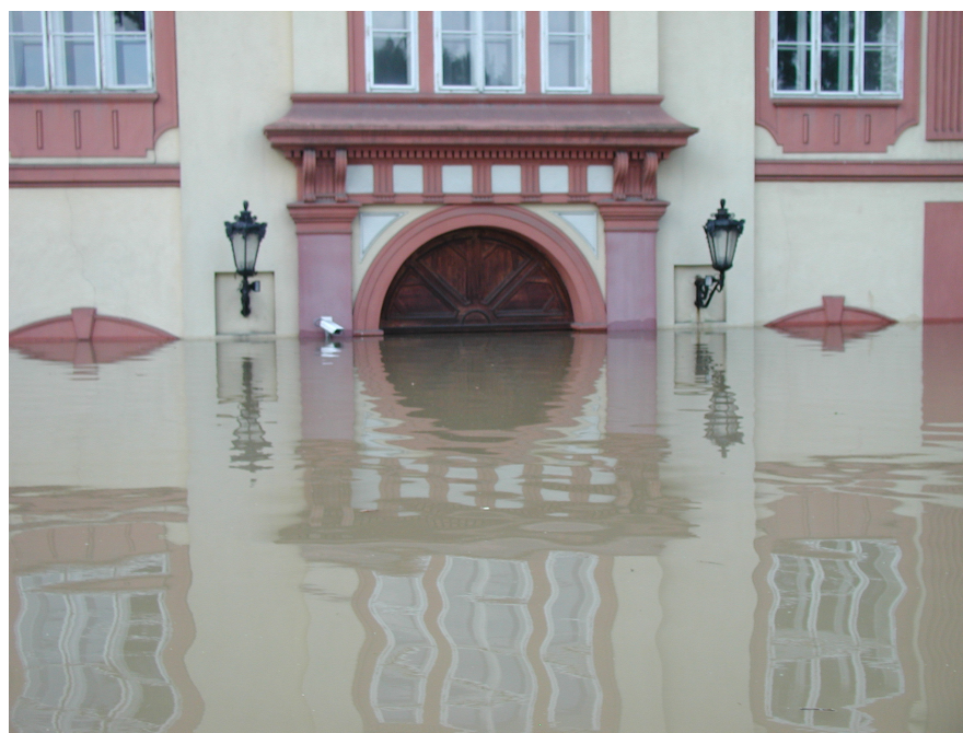
Zatopená brána zámku v Liběchově (Národní muzeum)

pouze v Muzeu Šumavy v Sušici (mírně zatopeny sklepy), Západočeském muzeu v Plzni (zatopené sklepy muzea), Západočeské galerii v Plzni (zvýšená vlhkost) a Okresním muzeu v Klatovech, které má zaplaveny sklepy objektů lidové architektury v Chanovicích, kde je též zničena příjezdová komunikace.