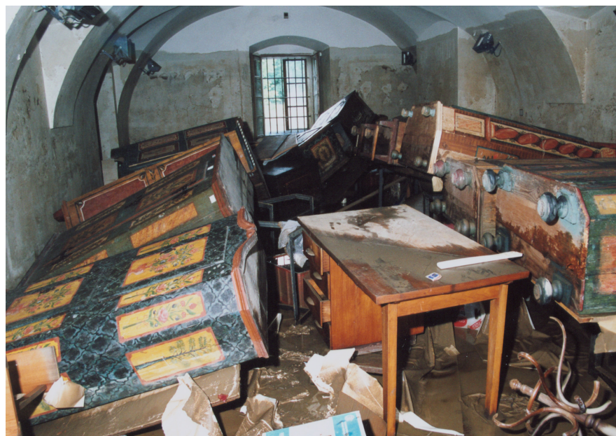
Depozitář lidového nábytku ve Středočeském muzeu v Roztokách u Prahy

Teplá a světlo domova 30.11.2002 - 30.12.2002