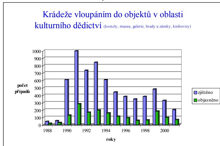
Graf č. 1