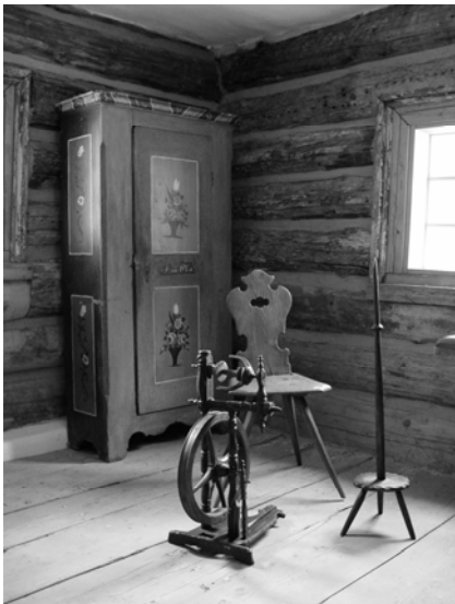
Interiérová expozice ve světnici domu

stavbou muzea je v plánu též postupné zbudování základní komunikační sítě mezi jednotlivými usedlostmi, využití stávající zeleně a vodoteče s rybníčkem. V souvislosti se zprovozněním jednotlivých usedlostí bude též provozován v omezené formě chov hospodářských zvířat. V areálu MVS se dochovaly sádky na ryby, které by v budoucnu měly být spolu s vhodným objektem – například rybářskou baštou – využity pro malou expozici mapující vývoj rybníkářství a chov ryb na Sedlčansku, a to především v souvislosti s působením Jakuba Krčína z Jelčan a Sedlčan v tomto regionu ve 2. polovině 16. století.