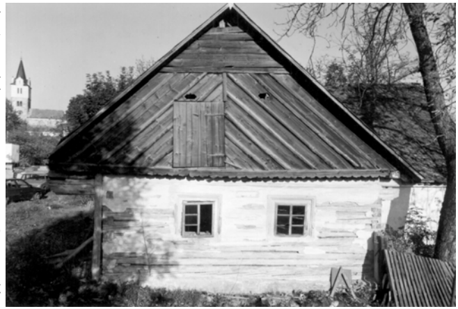
Obděnice čp. 4, stav před přenesením objektu do Muzea vesnických staveb (foto P. Dostál, 2000)

vodně z obce Dolní Sloupnice (bývalý okr. Ústí nad Orlicí). Jde o unikátní zařízení pocházející z druhé poloviny 19. století a v budoucnu bude druhým zařízením podobného typu umístěným v muzeích v přírodě na území Čech. Jde o vodní pilu s vodorovným řezným listem umožňujícím řezat k l á d y s velkým průměrem. Posun vozíku s kládou byl zajišťován