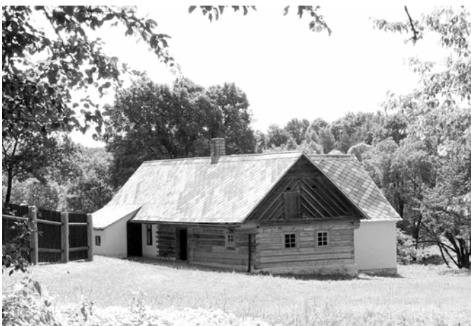
Obděnice čp. 4, stav před zpřístupněním objektu

V roce 2001 získalo Okresní muzeum v Příbrami od svých sbírek na Vysoký Chlumelec složené zařízení vodní pily (katru), s jejíž výstavbou se započalo ke konci roku 2001 budováním základů a kamenné spodní části (tzv. podpílí). Pila pochází pů-