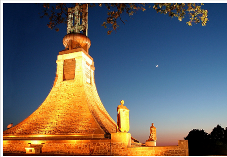
Památník Mohyla míru ve svitu Měsíce a Venuše o Muzejní noci

Mimořádný ohlas měla Muzejní noc u návštěvníků (ale i u organizátorů a aktivních účastníků) také v Podhorác-