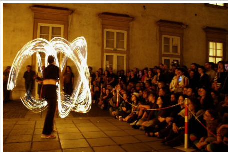
Moravská galerie v Brně – Místodržitelství palác

Každá ze třinácti institucí, která se na muzejní noci podílela, počítala svou návštěvnost zvlášť a výsledný počet je součtem jednotlivých vstupů. Jen pro srovnání – v loňském roce, kdy devět kulturních institucí zdarma otevřelo svých osmáct budov, vyrazilo za kulturou (z dnešního pohledu pouhých) necelých sedmdesát tisíc zájemců.