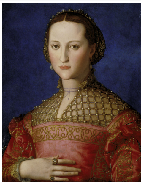
Agnolo Bronzino: Eleonora z Toledo, 1543 (olej na plátně)

zici postihující celé kulturní klima doby. Rovněž se snaží prezentovat díla umělců, které komunistická totalita opomíjela. Systematicky reinterpretuje umělecké dějiny na území českého státu a hlásí se k tradici, která je v mnoha oblastech výjimečná i v celosvětovém měřítku.