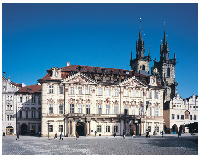
Sídlo NG v Praze — Palác Kinských na Staroměstském náměstí